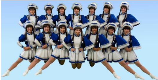
Hochfliegend . . . die Prinzengarde der Brucker Gaßhenker

Das Markenzeichen der Brucker Gaßhenker ist der Große Brucker Faschingszug am Faschings-sonntag, 15. Februar 2026, 14 Uhr. Damit machen sie seit Jahren ihren Stadtteil zum Nabel der Mittelfränkischen Metropolregion.