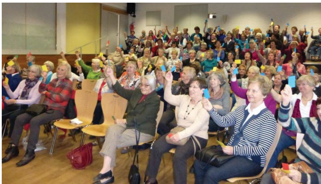
Volles Haus bei der Donnerstags-Veranstaltung im Großen Saal des Frankenhofes.

Hort in einer vertrauten Gemeinschaft für neue Unternehmungen.